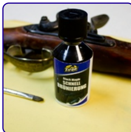
Bleuissement Tifoo Black Magic

Le bleuissage rapide Tifoo Black Magic est excellent pour le raccommodage des parties endommagées d'armes. Dans cet exemple, on voit la restauration d'une partie fortement utilisée d'un canon de fusil.